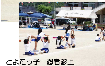
とよたっ子 忍者参上