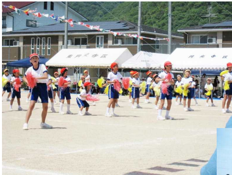
力を出し切った 応援合戦