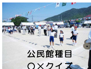
公民館種目 〇×クイズ